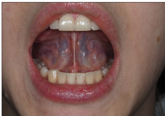
Fig. 3. Measurement of posterior tongue mobility involves measuring the interincisal distance at maximum mouth opening while the tongue is suctioned to the palate.

A noteworthy Polish classification is Ostapiukowa's classification, 14 which takes into account both anatomical-structural and clinical assessments. The anatomical-structural assessment focuses on evaluating tongue and frenulum mobility, attachment positions, the frenulum's position in relation to the frontal plane, the mucous membrane of the frenulum (including thickness and potential mucosal pallor caused by excessive tension). The clinical assessment, in addition to assessing coexisting orthodontic abnormalities, evaluates the resting position of the tongue, swallowing pattern, speech therapy evaluation, muscle tension, presence of compensations and breastfeeding difficulties.