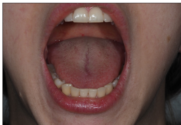
Fig. 1. CPO measurement involves measuring the interincisal distance at maximum mouth opening

Ryc. 1. Pomiar CPO polega na pomiarze odległości międzysiecznej przy maksymalnym rozwarciu jamy ustnej.