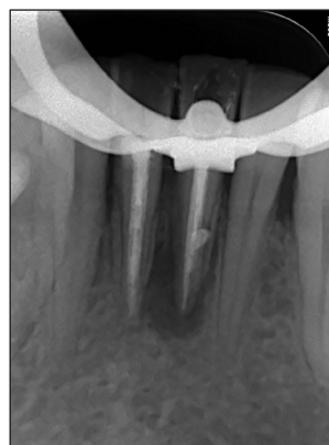
Ryc. 4 Zdjęcie RVG – stan po wypełnieniu kanałów w zębach 31,41.

Pacjentka zgłosiła się na badanie kontrolne po upływie 6 miesięcy od zakończenia leczenia. Nie zgłaszała dolegliwości bólowych. W badaniu klinicznym nie stwierdzono cech