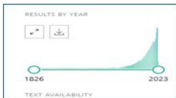
Ryc. 1. Wykaz wyszukiwania dla hasła „headache”, baza PubMed.