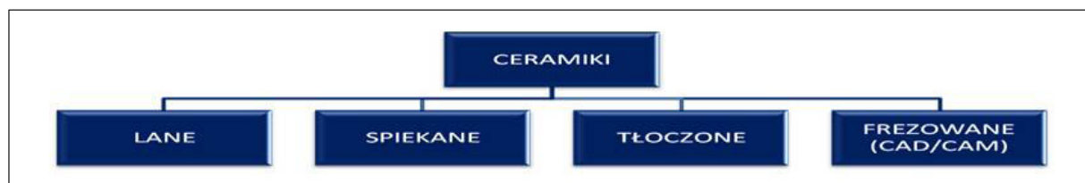
Fig. 1. Classification of ceramics acc. to processing technology.

Ryc. 1. Podział ceramiki ze względu na technologię przetwarzania.