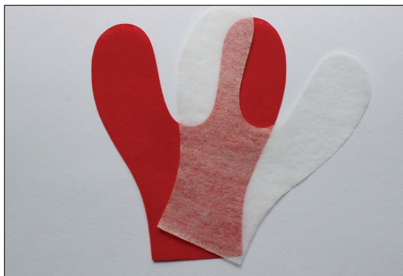
Ryc. 1. Kalka artykulacyjna z papierkiem włóknikowym.

Badaniem klinicznym została objęta 20-osobowa grupa pacjentów z pełnymi łukami zębowymi w wieku od 23 do 25 lat, u których nie została stwierdzona bólowa postać dysfunkcji narządu żucia. Badanie kliniczne składało się z dwóch etapów. W pierwszym etapie zakwalifikowano pacjentów do badania na podstawie przeprowadzonego wywiadu, badania stomatologicznego i czynnościowego. W kolejnej części pracy dokonano oceny kontaktów zębowych w zwarciu centralnym za pomocą kalki artykulacyjnej z papierkiem włóknikowym (ryc. 1), a