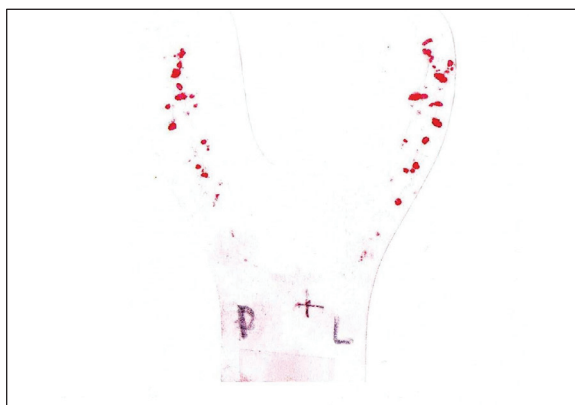
Ryc. 2. Zaznaczone kontakty na papierku włóknikowym.

następnie aparatem T-scan III. Badanie zostało przeprowadzone na fotelu stomatologicznym w pozycji siedzącej pacjenta z głową podpartą o zagłówek. Najpierw przeprowadzono badanie za pomocą kalki artykulacyjnej BK 54-100 \mu\text{m} (Bausch) i papierka włóknikowego Arti-Dry BK 609-80 \mu\text{m} (Bausch). Po wysuszeniu powierzchni zębów wprowadzono kalkę z papierkiem włóknikowym do jamy ustnej pacjenta (papierkiem do góry), zaznaczono na nim stronę prawą i lewą, linię zgodną z przebiegiem linii pośrodkowej i poproszono pacjenta o maksymalne zagryzienie (ryc. 2). Następnie wykonano pomiary aparatem T-Scan III (Tescan, Boston, USA). Po dopasowaniu rozmiaru sensora, wprowadzono go do jamy ustnej pacjenta, dbając o symetryczne ułożenie folii, prosząc o zagryzanie, rejestrowano powstające podczas