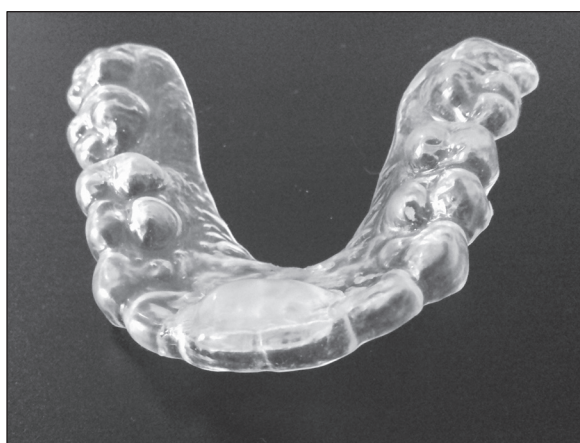
Fig. 3. Dawson B-Splint deprogrammer. Ryc. 3. Deprogramator Dawson B-Splint.

Sliding Guide deprogrammer is a standard device available in three sizes. It is made of hard polymer and is used for short-term deprogramming. During deprogramming, a patient should be relaxed in a stable sitting position with head slightly inclined. The deprogrammer is placed between the incisors of the mandible and the maxilla so that the end of the appliance can rest at the hard