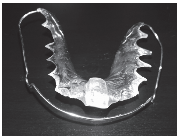
Fig. 1. Kois deprogrammer. Ryc. 1. Deprogramator Kois.